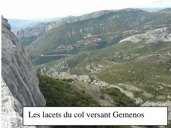
Les lacets du col versant Gémenos