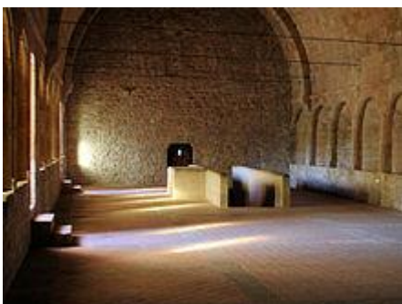
Le dortoir des moines